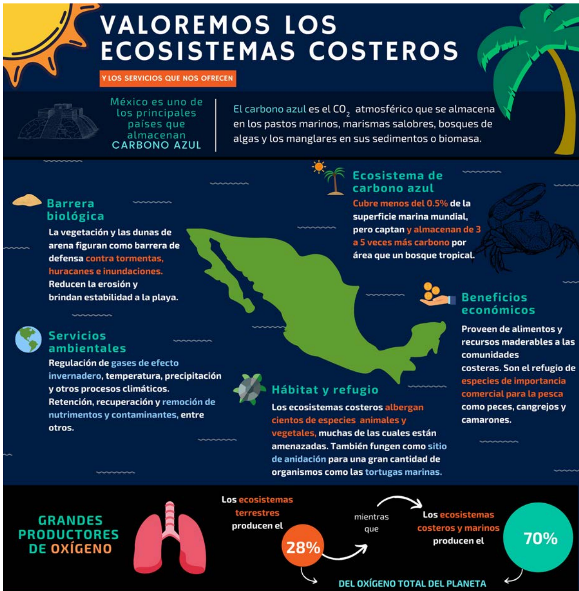
Infografía 5. Valorem los Ecosistemas Costeros.