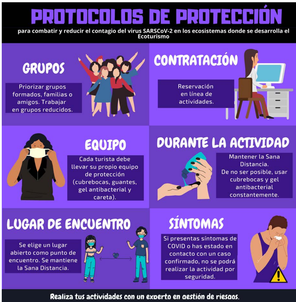
Infografía 2. Protocolos de protección para combatir y reducir el contagio del virus SARS-CoV-2 en los ecosistemas donde se desarrolla el ecoturismo.