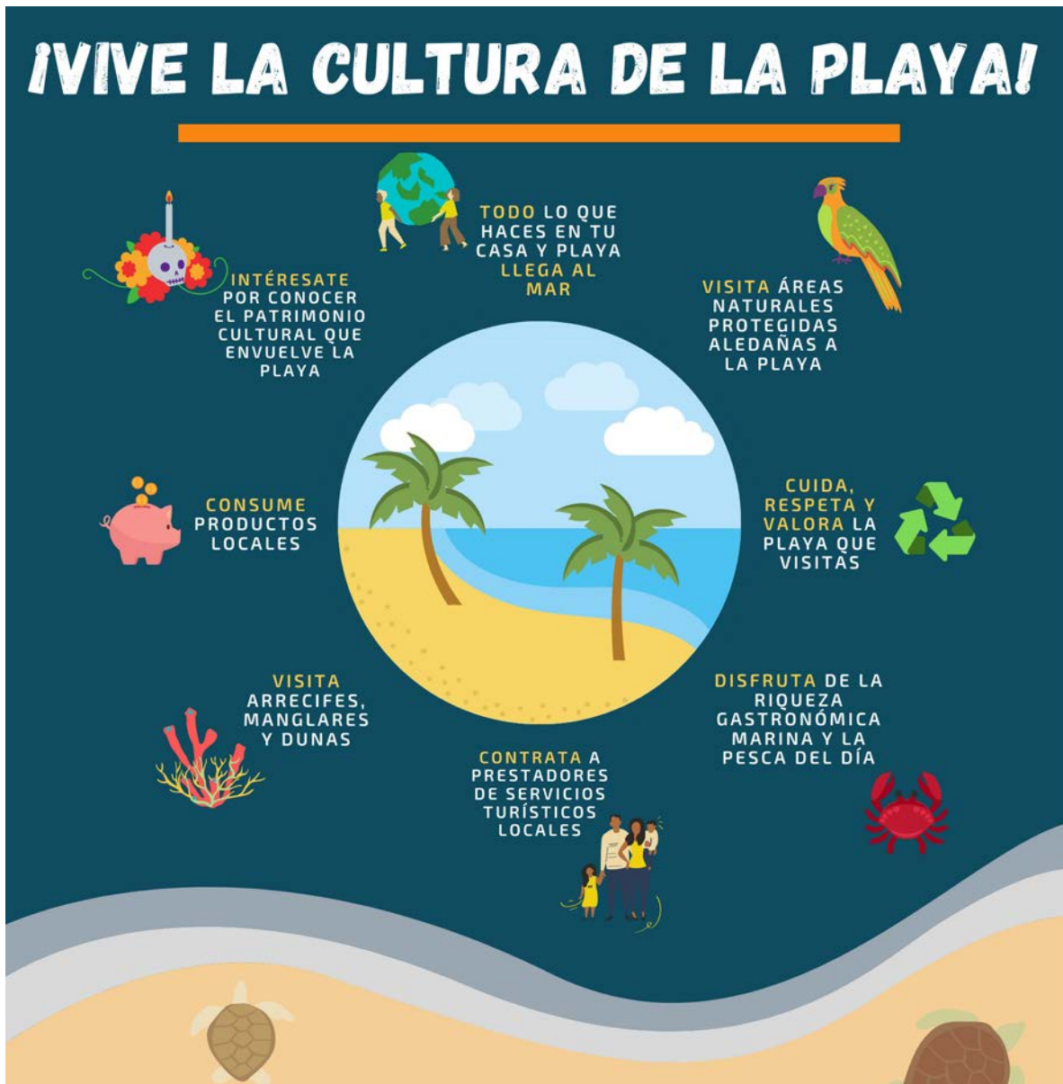
Infografía 4. La nueva cultura de la playa.