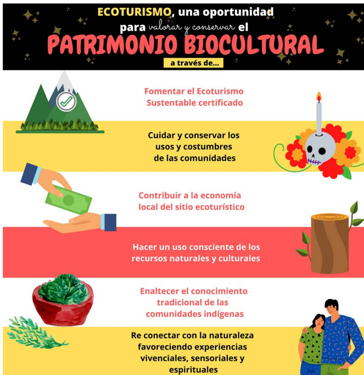
Infografía 3. Ecoturismo, una oportunidad para valorar y conservar el patrimonio biocultural.