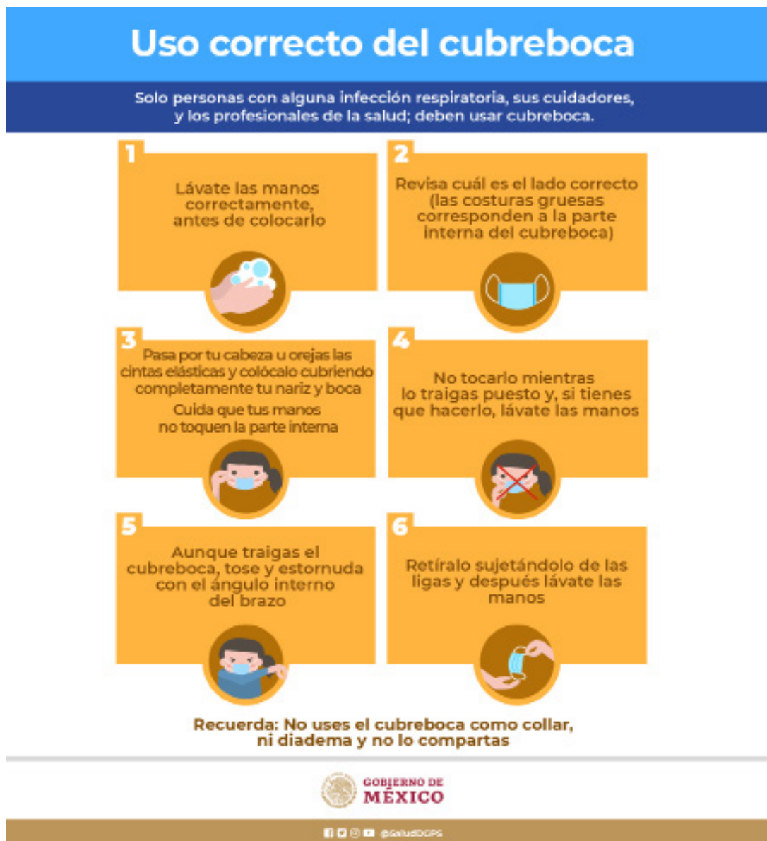
Infografía 9. Uso correcto del cubrebocas.