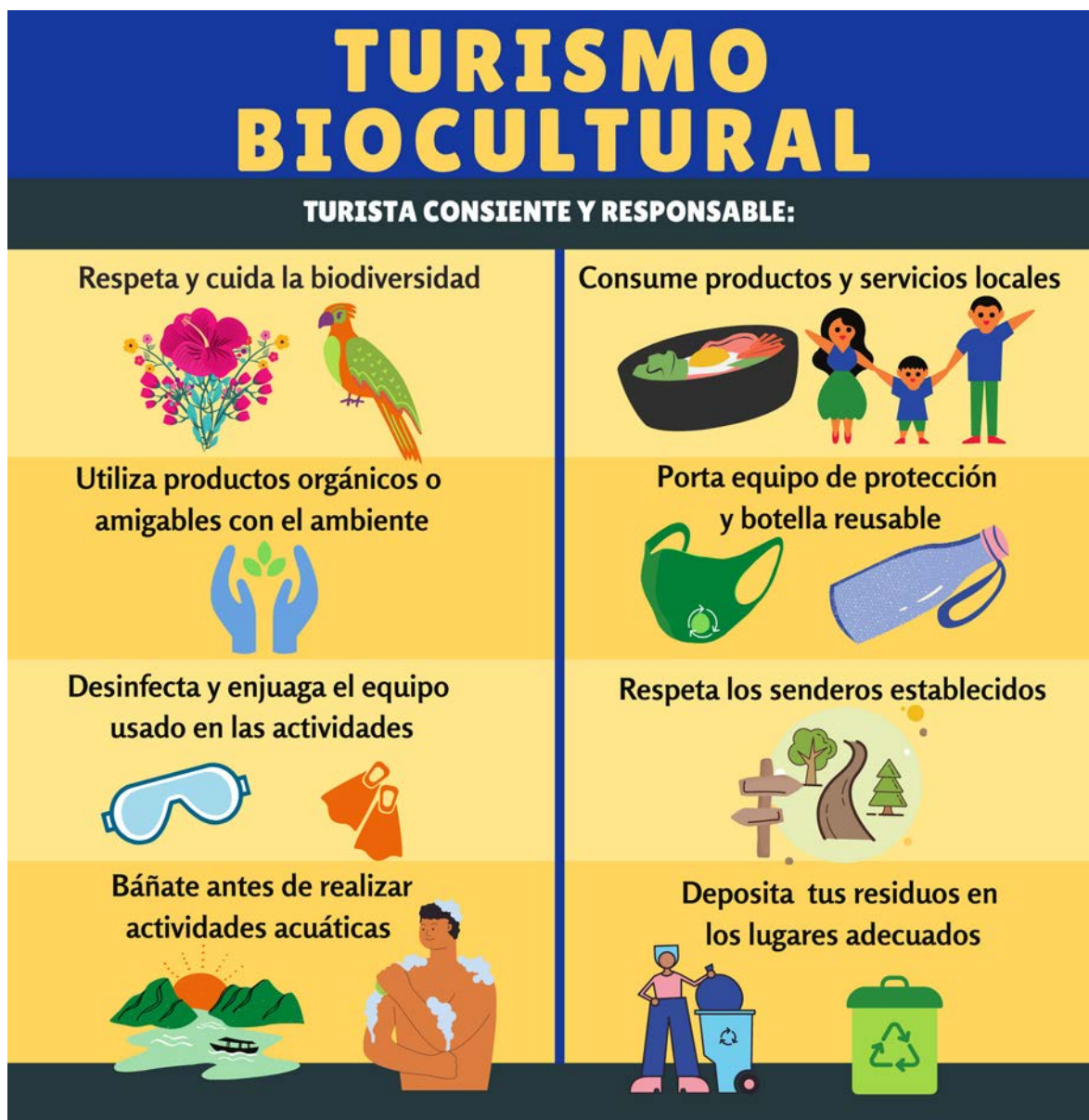
Infografía 1. Medidas para el ecoturismo.