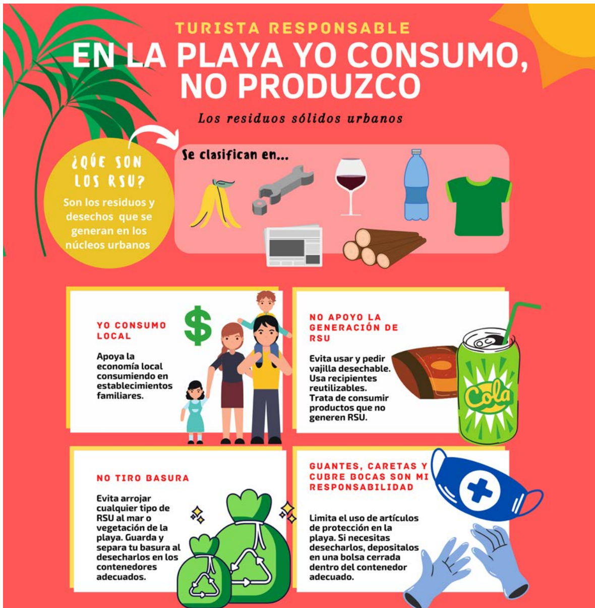
Infografía 7. Residuos Sólidos Urbanos (RSU).