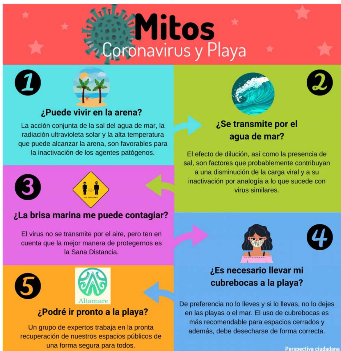
Infografía 10. Mitos y realidades.